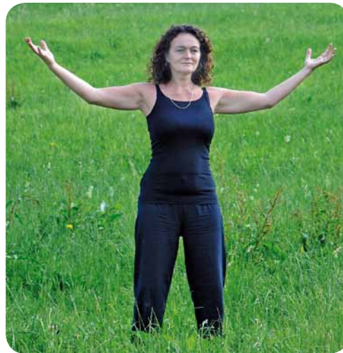
Position für den Leber-Laut

Beim Summen, Singen oder Intonieren eines Lautes – speziell eines Selbstlautes – werden mit ein wenig Übung im gesamten Organismus Schwingungen entstehen. Diese Vibrationen regen oftmals einen bestimmten Bereich im Körper besonders an. Mit den heilenden Lauten werden gezielt in-